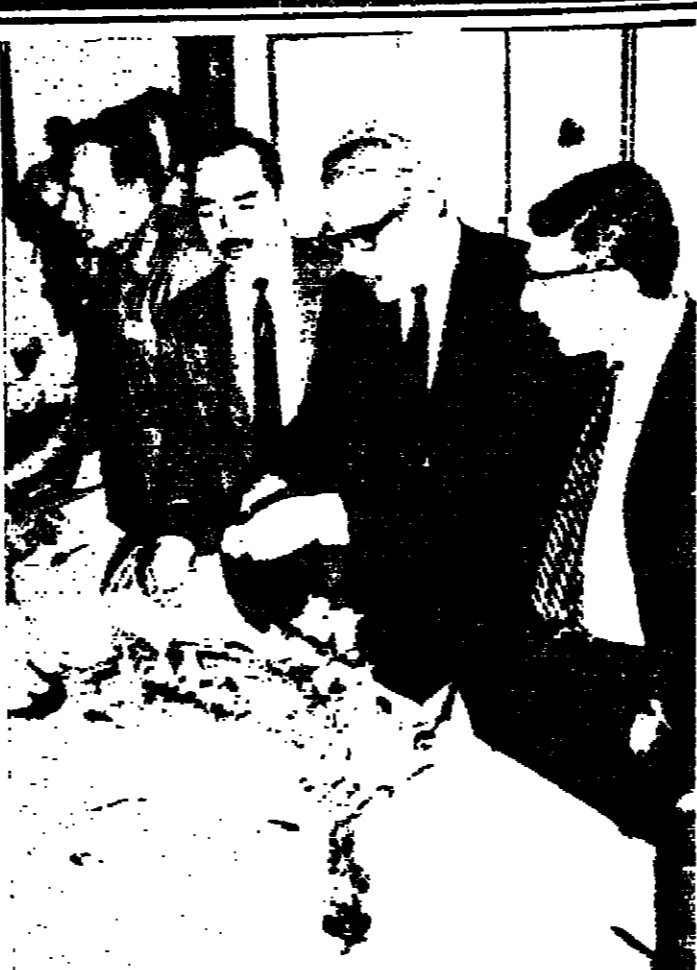
مشرحية ... (موتى بلا قيور)

عمان - قدمت وزارة الثقافة والاعلام مسرحية «موتى بلا قيور» تحت رعاية السيد صلاح أبو زيد وزير الثقافة والاعلام، حضرها عدد كبير من المواطنين بقيادة سمو الإمارة فرسان الخطبة والوزراء وعائلاتهم.